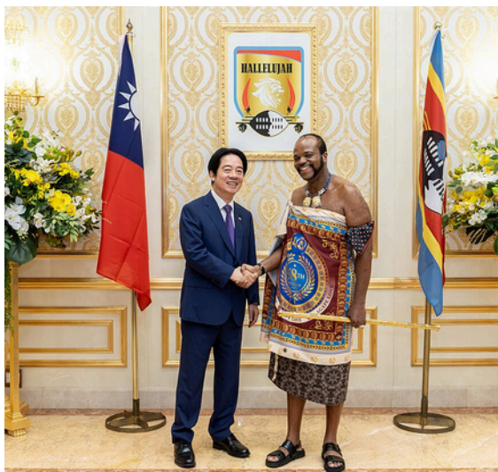
Poignée de main officielle entre Mswati III et Lai Ching-te

Les relations diplomatiques entre Taïwan et l'Eswatini, s'étant développées seulement quelques jours après l'indépendance de ce dernier, perdurent depuis 1968. Mais face à une telle avancée de la représentation chinoise en Afrique, comment expliquer que l'Eswatini reste fidèle à Taïwan ?