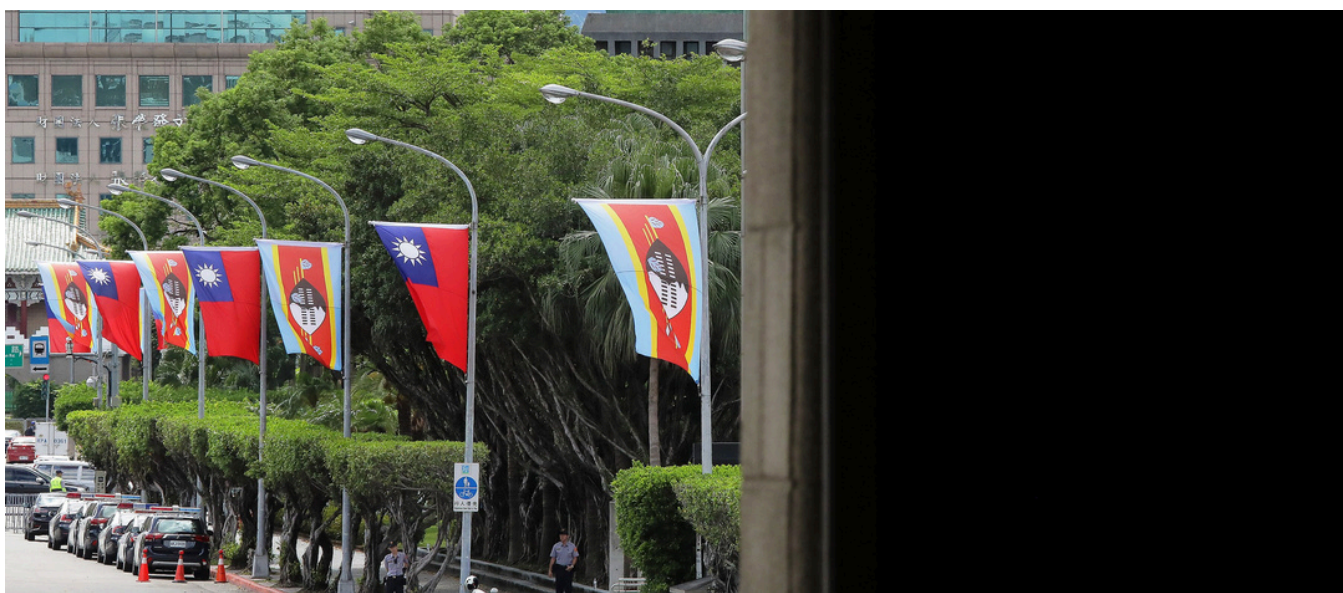
Drapeaux de l'Eswatini et de la République de Chine, Taïwan 2018

La visite diplomatique du président taïwanais Lai Ching-te en Eswatini a finalement pu avoir lieu samedi 2 mai 2026, dix jours après un premier report. Le président de la république insulaire a rencontré le Roi Mswati III dans son palais de Mandvulo, alors que son pays est le dernier État africain à reconnaître la souveraineté de la République de Chine.