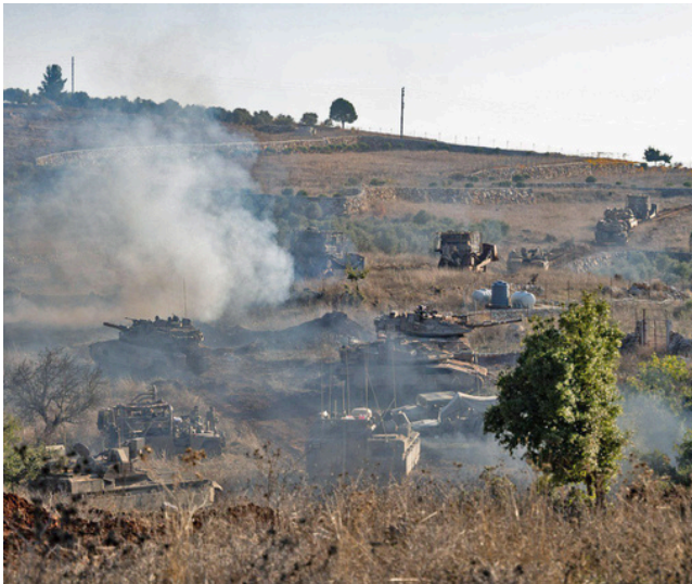
IDF operates in Lebanon

Depuis le 2 mars, le Liban est plongé dans un conflit armé d'une rare intensité. Après des attaques du Hezbollah contre Israël, l'armée israélienne a répondu par des frappes aériennes massives et une avancée terrestre dans le sud du pays. Selon le ministère libanais de la Santé publique, le bilan s'élève au 13 avril à 2 089 morts et 6 762 blessés. Plus d'un million de personnes ont également été déplacées à travers le territoire.