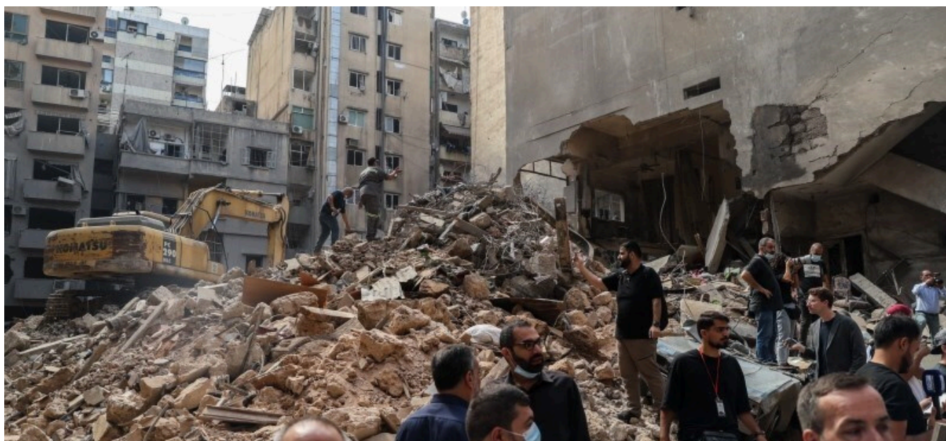
Bachoura strikes

Israël envisage de diviser le territoire libanais en trois zones, conditionnant tout retrait au désarmement préalable du Hezbollah. Seule une désescalade partielle, épargnant pour l'heure Beyrouth et sa banlieue, semble acquise : aucune frappe n'a touché la capitale depuis le 9 avril.