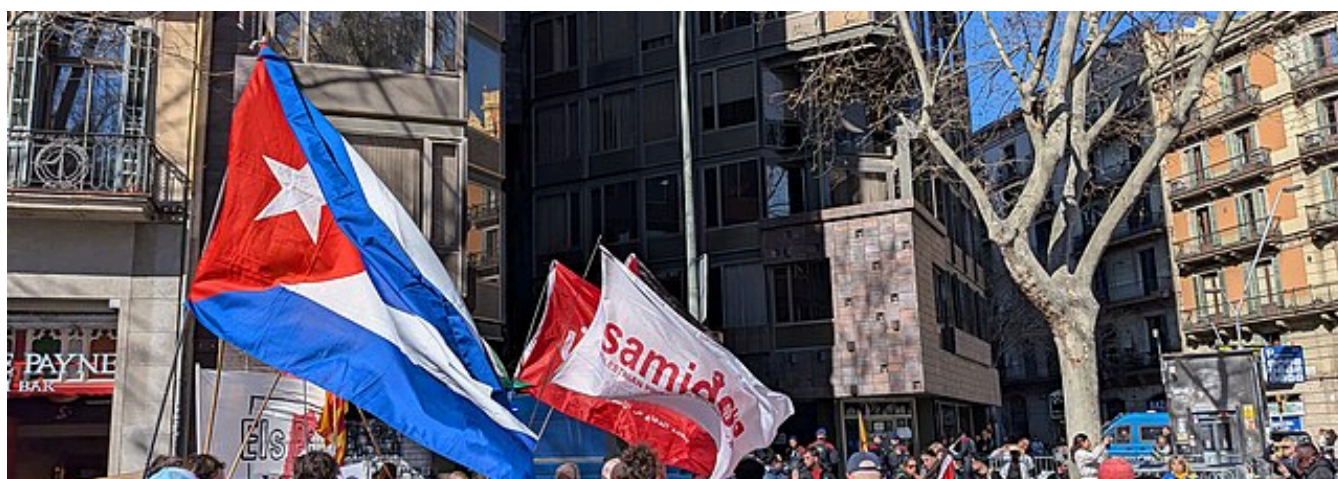
Manifestation contre l'embargo étasunien visant Cuba à Barcelone le 21.02.2026

Un convoi international d'aide humanitaire a atteint La Havane le mercredi 18 mars, transportant des denrées alimentaires, du matériel médical et des équipements solaires. Baptisée « Nuestra América », cette initiative est organisée par une coalition réunissant mouvements sociaux, syndicalistes, parlementaires, organisations humanitaires et personnalités engagées provenant du monde entier. Au total, ce convoi doit acheminer près de vingt tonnes d'aide vers Cuba, par voie aérienne et maritime.