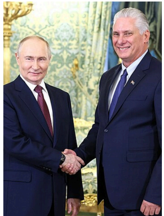
Rencontre entre Vladimir Putin et Miguel Díaz Canel

Ce possible approvisionnement représente un espoir pour Cuba, dont les services essentiels, production d'électricité, transports et système de santé, dépendent fortement des importations énergétiques. Dans un contexte de pressions internationales croissantes, l'île continue ainsi de chercher des soutiens pour faire face à une crise d'une ampleur inédite.