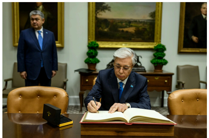
Le président du Kazakhstan Kassym-Jomart Tokaïev signant le livre d'or de la Maison blanche, 06.11.2025

En parallèle du sommet réunissant à Washington les membres du C5+1, Donald Trump a organisé une rencontre téléphonique entre le président du Kazakhstan Kassym-Jomart Tokaïev et le premier ministre israélien Benyamin Nétanyahou. Suivant cet appel, le président américain a annoncé que le Kazakhstan rejoignait les accords d'Abraham. Cette adhésion aux accords ayant pour vocation de normaliser les relations diplomatiques d'Israël avec les états arabes est une surprise. En effet, le Kazakhstan possède déjà des relations diplomatiques avec l'état hébreu, et ce depuis son indépendance au début de la décennie 1990. Il s'agit donc d'une adhésion principalement symbolique, visant avant tout à renforcer les liens avec les Etats-Unis, par l'intermédiaire de Donald Trump.