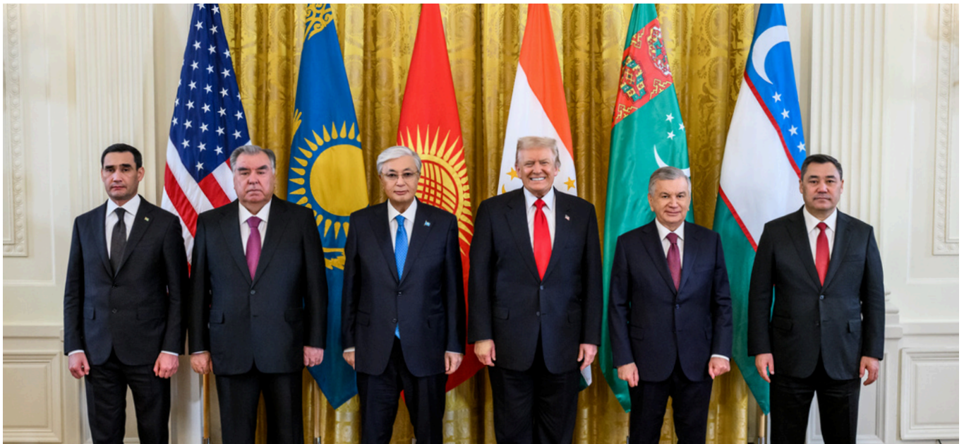
Rencontre des dirigeants du C5+1 à Washington, le 06.11.2025

Le 6 novembre 2025, les dirigeants des pays d'Asie centrale membres du C5, à savoir le Kazakhstan, l'Ouzbékistan, le Turkmenistan, le Kirghizistan et le Tadjikistan, ont rencontré leur homologue américain Donald Trump à la Maison blanche. Dans le cadre de ce sommet, le Kazakhstan a notamment annoncé rejoindre les accords d'Abraham avec Israël.