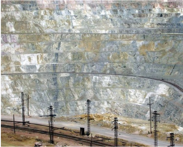
Mine de cuivre de Kounrad, Kazakhstan

Ce sont des motivations économiques qui permettent toutefois d'expliquer l'intérêt des grandes puissances en Asie centrale. Cette région repose sur des réserves minières et énergétiques importantes. Celles-ci sont vitales dans le développement des nouvelles technologies, ainsi que dans le domaine industriel, et notamment militaire. Les terres rares sont donc au coeur de la politique diplomatique de Donald Trump. Depuis le début de son mandat, il a déjà conclu plusieurs accords à ce sujet, avec le Japon, l'Ukraine ou la RDC, car jusqu'à présent, la Chine demeure de loin le principal leader dans leurs extractions et leur transformations. Ce déséquilibre entre les deux puissances rivales est un argument de poids en défaveur de Donald Trump dans ses négociations commerciales avec le dirigeant chinois. Le président américain a ainsi réduit ses tarifs douaniers envers la Chine le 30 octobre dernier, contraint par la menace d'une restriction des exportations de terres rares vers les Etats-Unis.