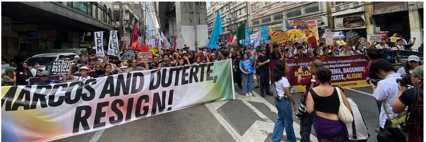
2025 Philippine anti-corruption protests, le 16.11.2025 Manille, Philippines

Le dimanche 16 novembre, plus d'un demi-million de personnes se sont rassemblées à Manille pour participer à l'une des plus grandes manifestations publiques de l'histoire récente des Philippines. Le rassemblement, organisé par l'Iglesia Ni Cristo (INC) dans le cadre d'une mobilisation nationale de trois jours, a été conduit par cette organisation religieuse influente, connue pour son poids politique considérable. On estime qu'environ 650 000 personnes se sont rassemblées vers le centre de la capitale, entraînant la fermeture de routes, la suspension des cours et l'arrêt temporaire de plusieurs administrations publiques.