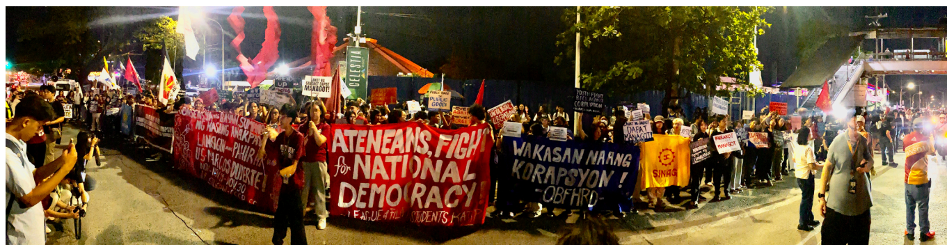
2025 Philippine anti-corruption protests, le 16.11.2025 Manille, Philippines

Pour de nombreux participants, cette mobilisation exprime à la fois leur attachement à leur foi et leur préoccupation face à la corruption. Par conséquent, les répercussions sur l'avenir politique des Philippines demeurent, pour l'heure, incertaines.