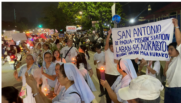
2025 Philippine anti-corruption protests, le 16.11.2025 Manille, Philippines

De nombreux membres de l'INC présents à la manifestation ont décrit leur participation comme un devoir religieux autant qu'une expression de préoccupation citoyenne. Des familles venues de tout le pays ont installé des tentes, des bâches, des équipements de cuisine et des provisions pour camper durant les trois jours de mobilisation. Les manifestants brandissaient des pancartes exigeant responsabilité et transparence, portant des messages tels que « Exposez les actes ».